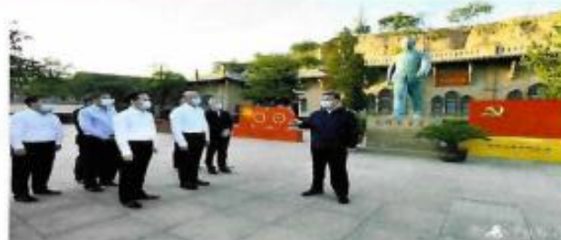
习近平在陕西榆林考察调研