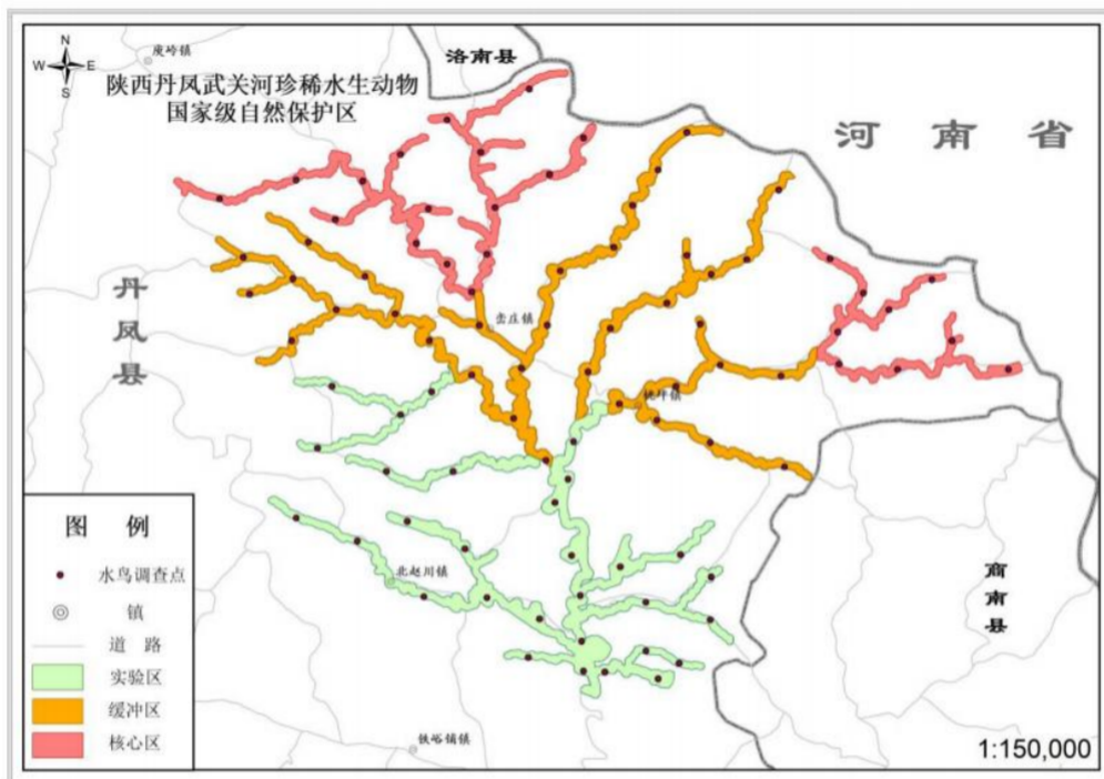
附图 7 陕西丹凤武关河珍稀水生动物国家级自然保护区 2024 年中央财政林业草原生态保护恢复资金项目水鸟调查预设点位布局示意图