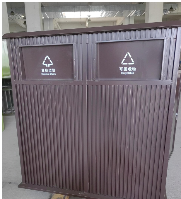
两分类果皮箱平面示意图