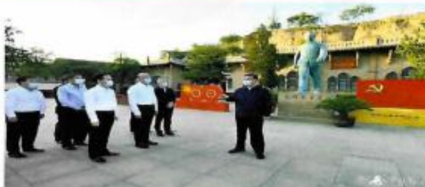
习近平在陕西榆林考察调研