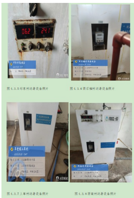
(3) 现场出力不足消毒设备（部分）