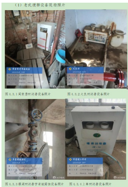
(2) 电极板腐蚀及计量泵损坏现场设备照片（部分）