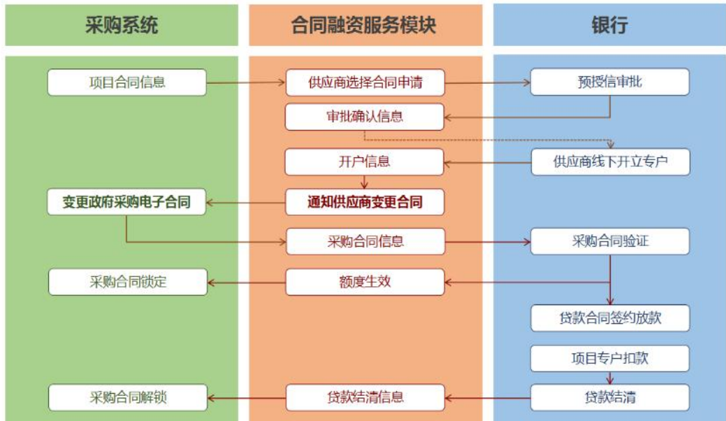
已签订采购合同申请流程